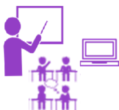
Kadra z Klasą